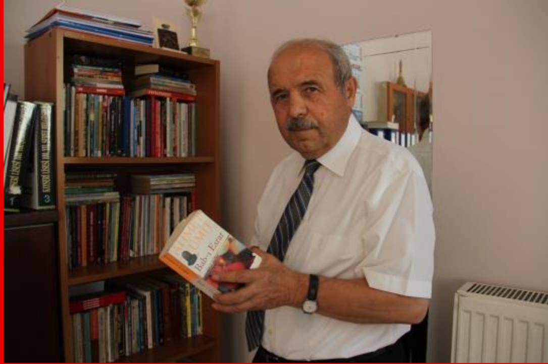
Sigaraya para vermek yerine 10 bin kitap aldı