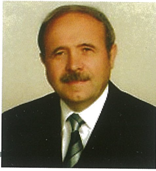
Hazırlayan Yusuf Özmerdivenli Kayseri Lisesi Emekli Müdür Yrd. ve Fizik Öğretmeni