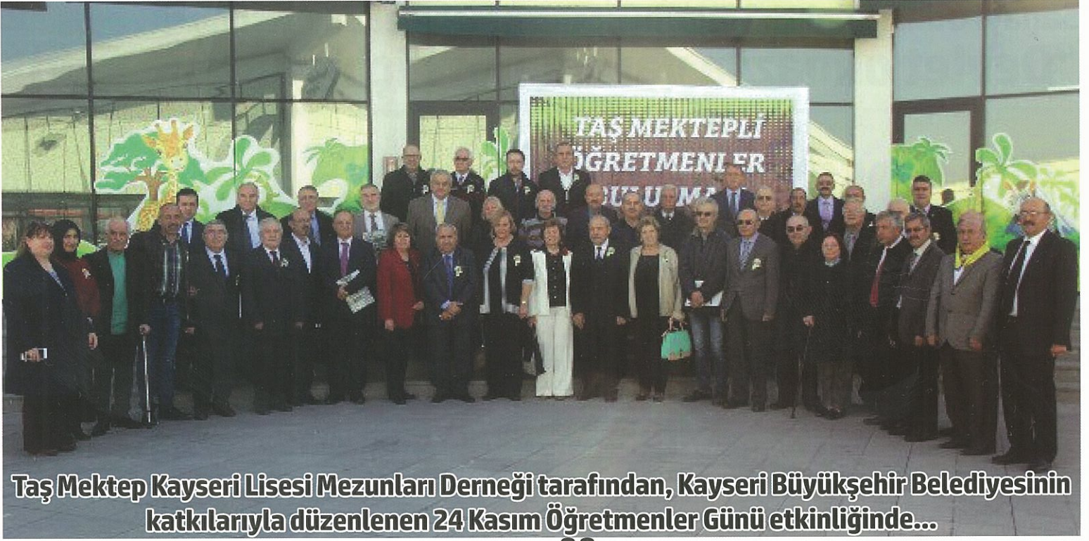
Taş Mektep Kayseri Lisesi Mezunları Derneği tarafından, Kayseri Büyükşehir Belediyesinin katkılarıyla düzenlenen 24 Kasım Öğretmenler Günü etkinliğinde...